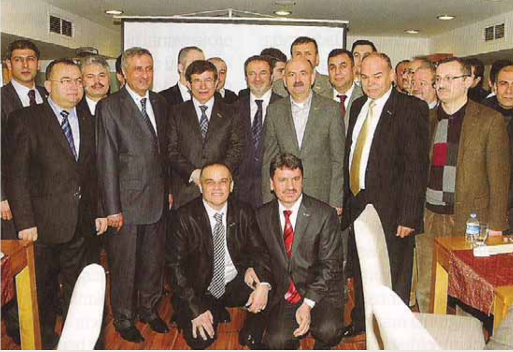
KONSİAD Üyeleri Dışişleri Bakanı Prof. Ahmet DAVUTOĞLU ile birlikte

Türkiye'mizin parlayan yıldızı Konya'nın, İş adamlarının kurduğu, Konyalı Sanayici ve İşadamları Derneği (KONSİAD), sanayileşmiş Konya'nın yurt içinde ve yurt dışında daha iyi tanıtılabilmesi için turizm alanında da çalışmalarına devam etmektedirler. Konya ili ve ilçelerindeki tüm vakıf ve dernekleri kucaklayıp onlarla iş birliği yaparak tanıtım faaliyetleri içinde yer almalarına ön ayak olmaktadır. Bunun en çarpıcı örneklerinden biride KONEXPO'dur.