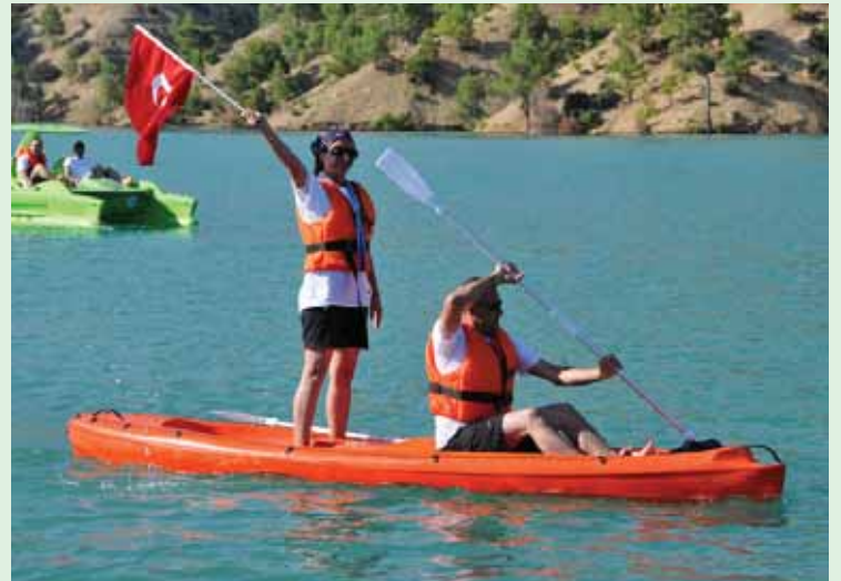
Ermenek Baraj Gölün' den görüntüler