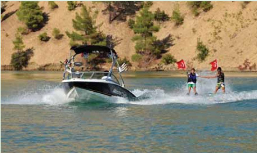
Ermenek Baraj Gölün' den görüntüler