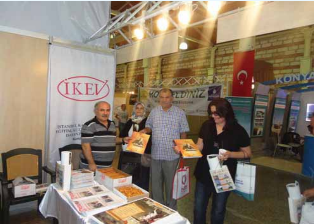
Konexpo'da İKEV standı

Konyalı Sanayici İşadamları Derneği, KONSİAD'ın İstanbul Feshanede düzenlediği KONEXPO Fuarında sadece Konya'nın işadamlarına değil, Konya İli ve ilçelerinin vakıf ve dernekleri ile birlikte İKEV'e de stand yeri ayırmaları sivil toplum kuruluşlarına verdikleri önemin bir göstergesidir.