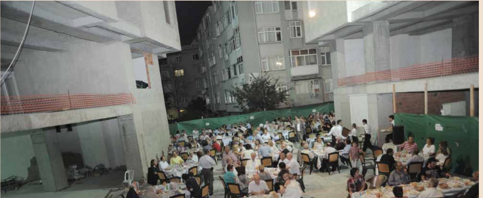
Vakfımızdaki iftara katılan hemşehrilerimiz

Vakfın daha fazla güçlendirilmesi ve imkanlarının genişletilmesi,