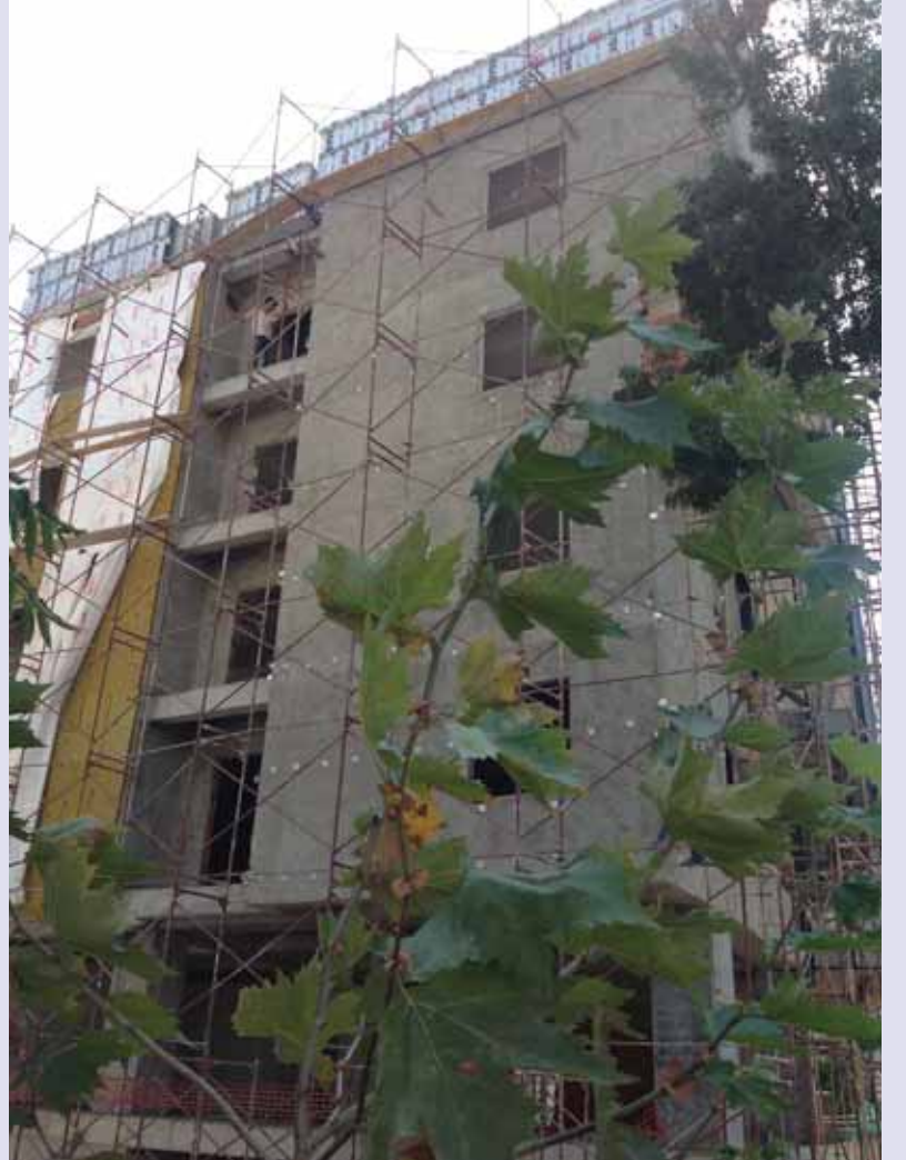
İnşaatımızın değişik cephelerinden görüntüler