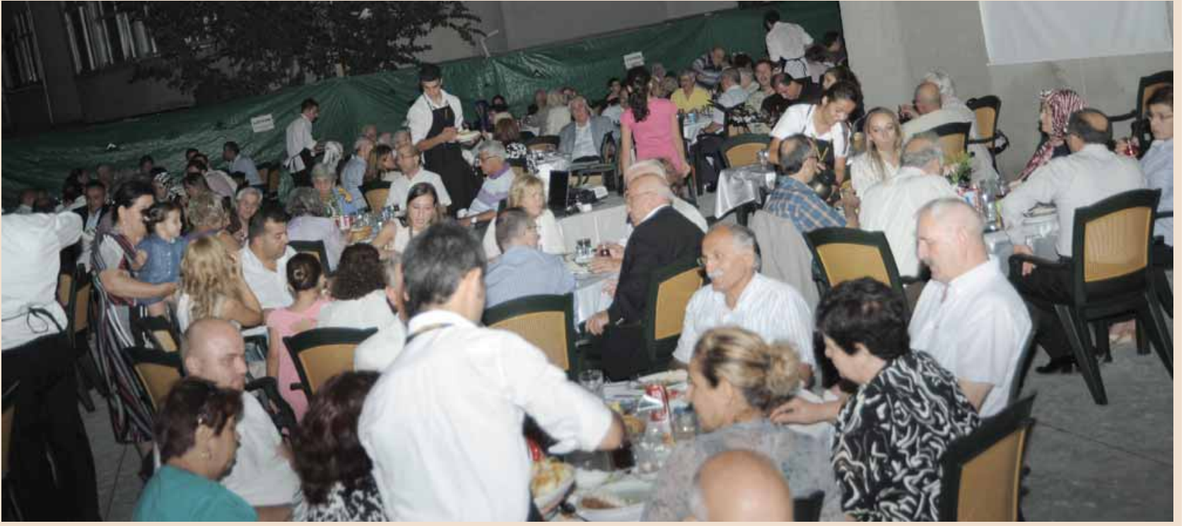
Vakfımızdaki iftara katılan hemşehrilerimiz

Vakıf Yönetim Kurulu Üyelerimizin özverili çalışmaları sonucunda bugün inşaatı bitirme noktasına geldik. İnşallah 2012 yılı sonunda bitireceğiz.