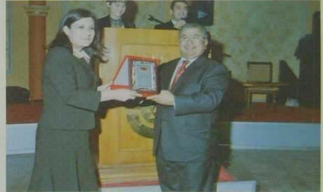
İstanbul Karamanlılar Yapı Koop. Karaman Doğu Kışla'daki toplam 6750 m 2 8 adet apartman arsasını vakfımıza bağışladığı için kooperatif adına Suat Sezer Devlet Bakanımız Nimet Çubukçu'dan plaketi alırken.