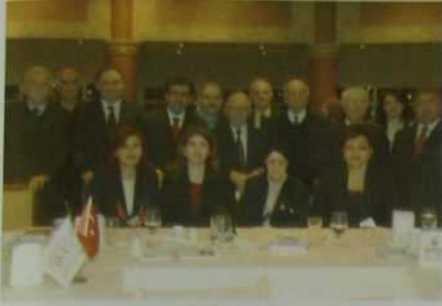
Sn. Valimiz ve Sn. Belediye Başkanımız, değerli eşleri ve hemşerilerimizle