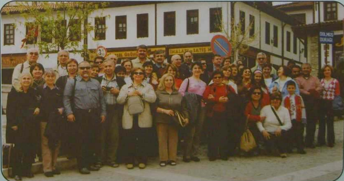
Geziye katılan kafilemiz toplu halde

8 Nisan Cumartesi sabahı ilk toplanma merkezi olan Ataköy Atrium önünden ilk yolcularını alan otobüstümüz Saat 07.30'da Kozyatağı Güllüoğlu Tesislerinin önünden alınan son konuklarla kafilé tamamlanarak neşeli bir şekilde gezi programı gereği, kahvaltının yapılacağı Bolu Dağı'ndaki Koru Motel'e doğru hareket edildi. Koru Motel'de yapılan kahvaltının ardından yine şarkılarla, fıkralarla neşeli bir şekilde Safranbolu'ya hareket edildi. Saat 14.00 sularında Safranbolu'ya ulaşan kafilemiz tarihle iç içe yaşayan, yurdumuzun bu şirin ilçesinde rehberimiz refakatinde unutulmaz saatler geçirdi. Daha sonra Amasra'daki otelimize geldik. Odalarımıza yerleştikten sonra akşam yemeğinde otelin restaurantında buluşan kafilemiz, canlı müzik eşliğinde yemeğini yerken eğlenmenin doruğuna vardı.